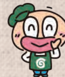
コープしがキャラクター ばくばく君