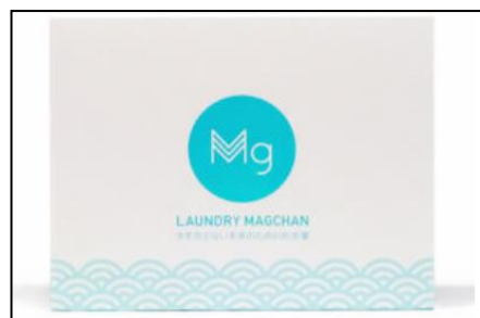
ランドリーマグちゃん