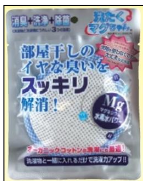
洗たくマグちゃん