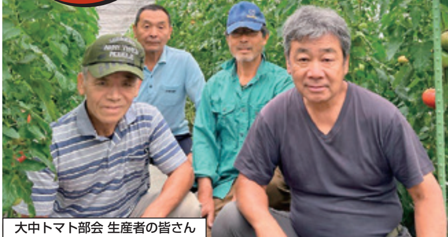
大中トマト部会 生産者の皆さん