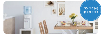
コンパクトな卓上サイズ!

サイズ/幅272×奥行420×高さ487mm(レギュラーボトル装着時の高さ756mm) 重量/最大30kg(レギュラーボトル装着時)