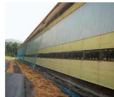
防鳥ネット(《産直たまご》生産者の大鳥養鶏場)

一方的な点検とならないように、生産者と協力しながら取り組みを進めています。点検の結果については、生産者の皆さんと定期的に協議を行い、結果の共有と共に改善の目標を決めて取り組みをすすめています。