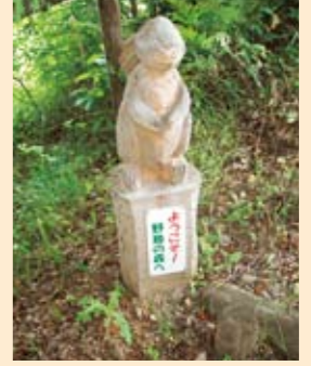
道標の木のうさぎ

野鳥を知ろう 「県立野鳥の森ビジターセンター」には、ニホンジカやクマタカ はくせい の剥製なども展示され、こが森の中であることを実感します。大きなガラス窓の観察室もあり、外には巣箱がいくつも掛けられています。また野鳥が好きな木や、庭に野鳥を呼ぶためのエサ台の作り方が学べる展示室や図書室もあります。