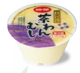
「茶わんむし」は別々だった仕入れをコープきんぎで一括し、コスト削減した代表商品。

製造コストを下げられました。代表的なのが茶わんむしです。このとき、生協ごとに味などが違っていたため、試作品をモニターアンケートにかけて、最も支持の高いものを採用。これがきんぎ商品のデビューです。共同化しているのはその他、商品案内書の作成や商品検査から、配達時のドライアイスまでたくさんあります。別々に行うよりはまとめた方が効率がよくなり、経費も減らせます。きんぎ商品は決して、品質を落とさず、安くしているのではないのです。