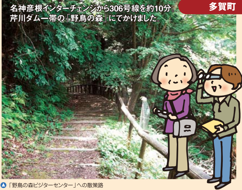
「野鳥の森ビジターセンター」への散策路